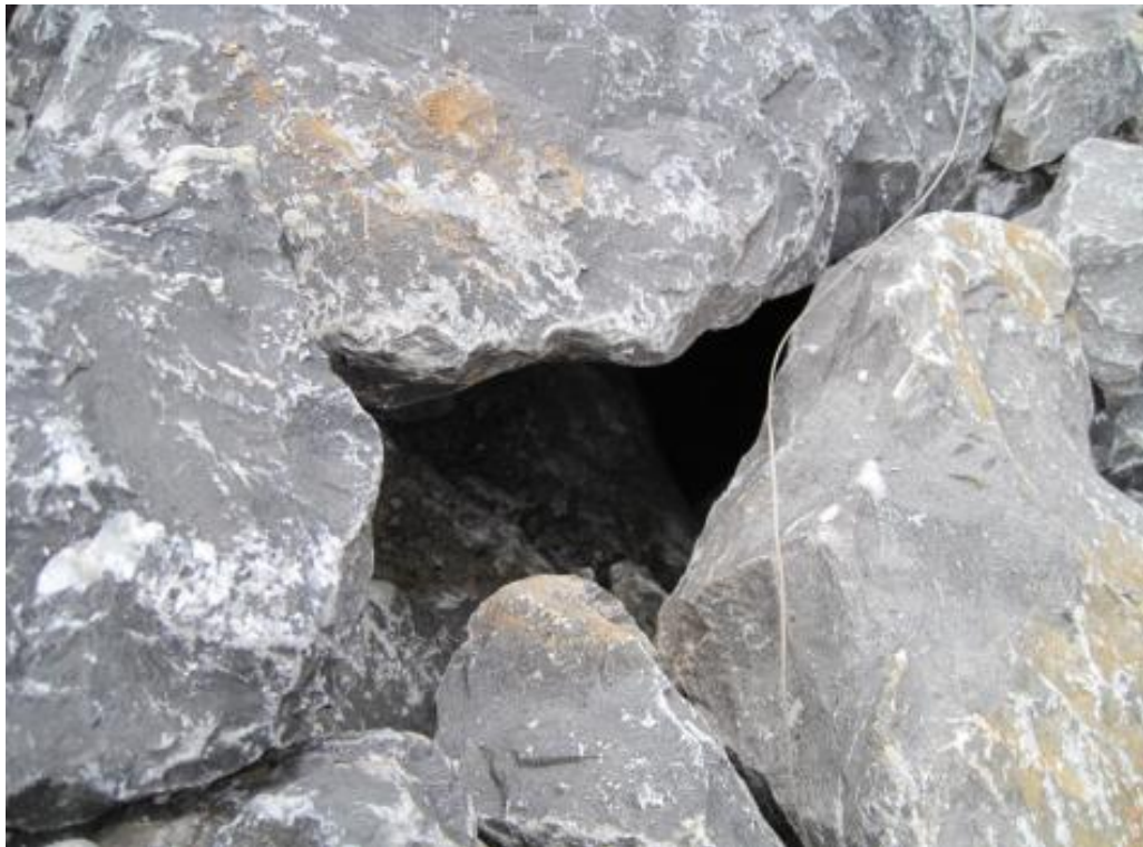
× × 质量管理图 1-2 干砌块石架空

备注：现场图片既要拍摄工程整体状况，也要拍摄重点部位的细部情况，可在其中圈出关键部位，图片务必清晰、准确、真实。